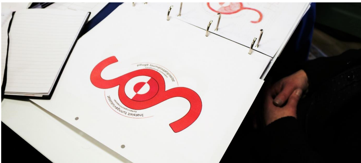
Forfatningskommissionens logo.

I perioden 1. januar – 10. september 2018 havde sekretariatet til huse i midlertidige lejede kontorlokaler (Samuel Kleinschmidtsvej 15, st.), indtil sekretariatet kunne flytte ind i mere egnede kontorlokaler på adressen Noorlernut 4, stuen - ved siden af Nuuk's forsamlingshus.