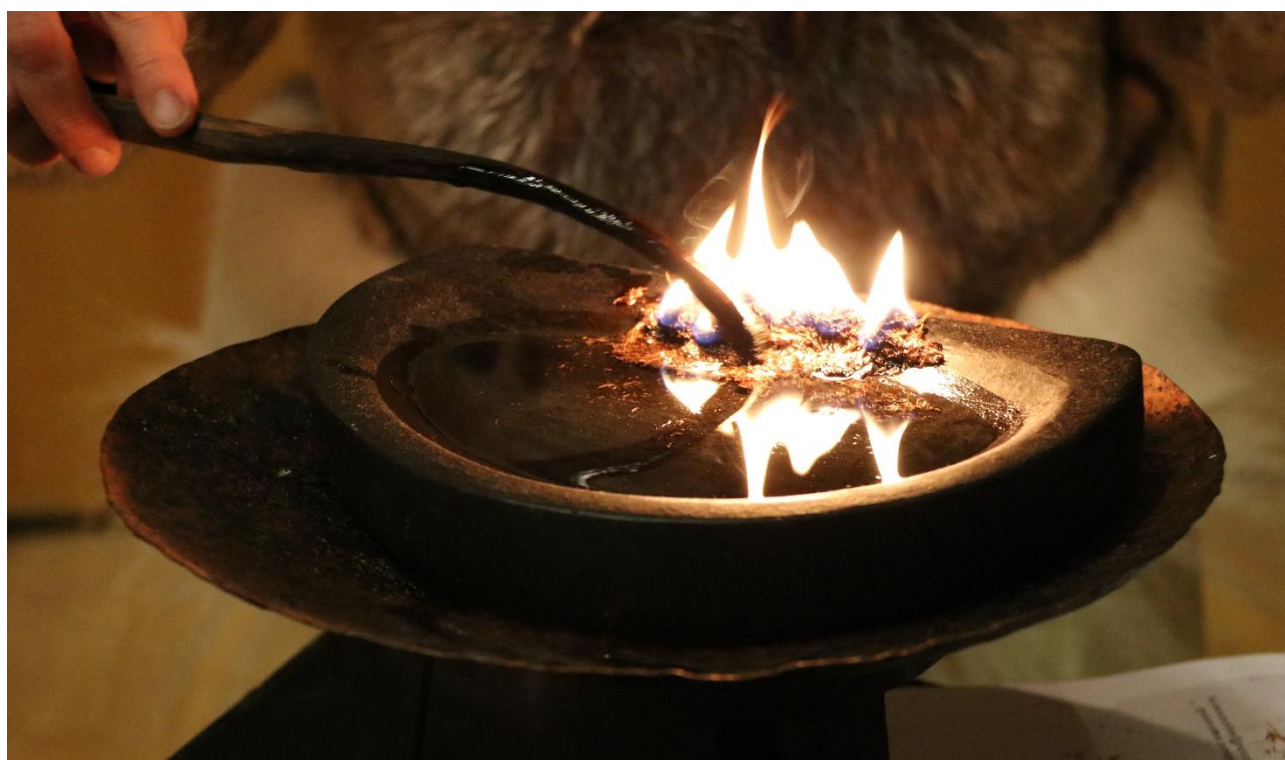
Tukummeq Qaavigaq tænder en lampe, 21.december 2017.