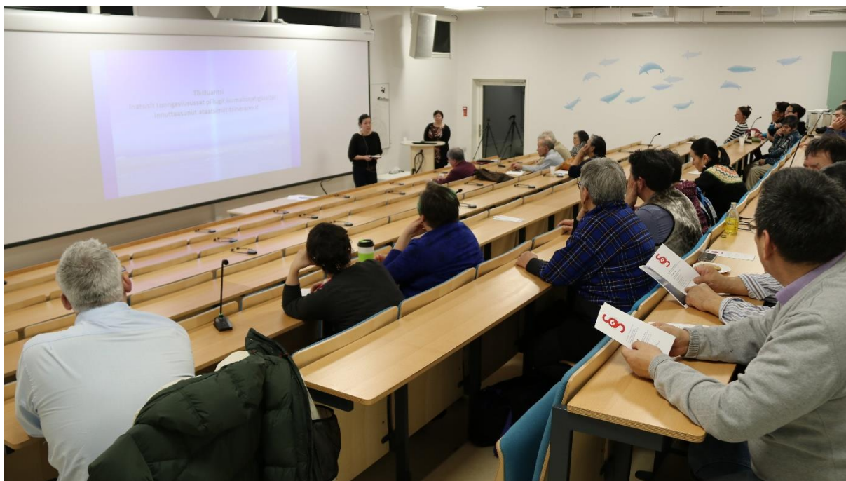
Forfatningskommissionen afholdte et borgermøde i Ilulissat i februar 2018.

Med udskrivelse af nyvalget til Inatsisartut blev de aktuelle planer for borgerinvolvering og borgerinddragelse imidlertid indstillet og der blev således ikke arrangeret flere borgermøder i den resterende del af 2018.