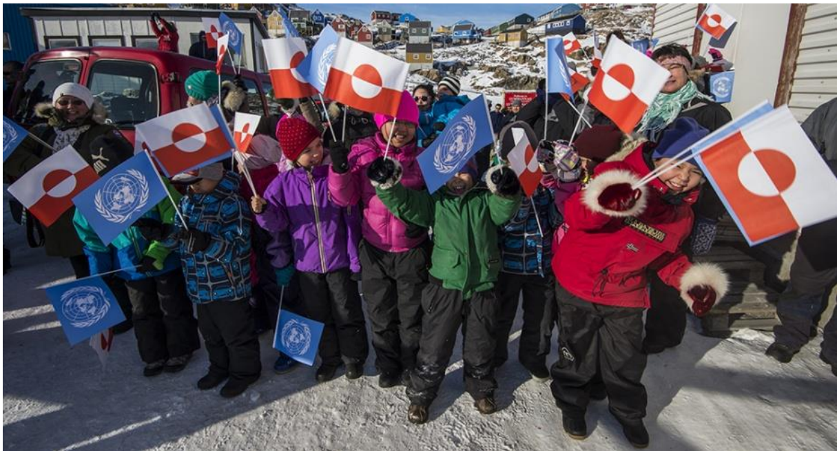
Børn byder Ban Ki Moon velkommen til Uummannaq marts 2014.