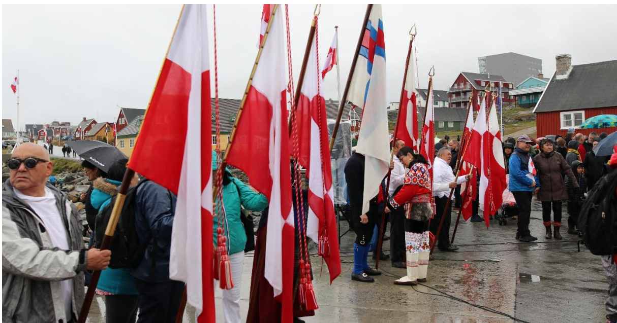
Nationaldag 21. Juni 2018, Nuuk.