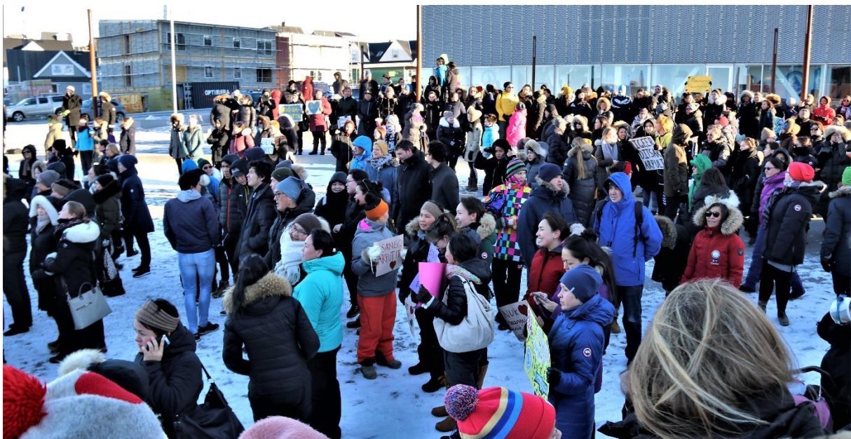
Demonstration imod selvmord, Nuuk oktober 2018.

Endelig har sekretariatet indsamlet og systematiseret en samlet oversigt over alle landes forfatninger, se https://www.constituteproject.org