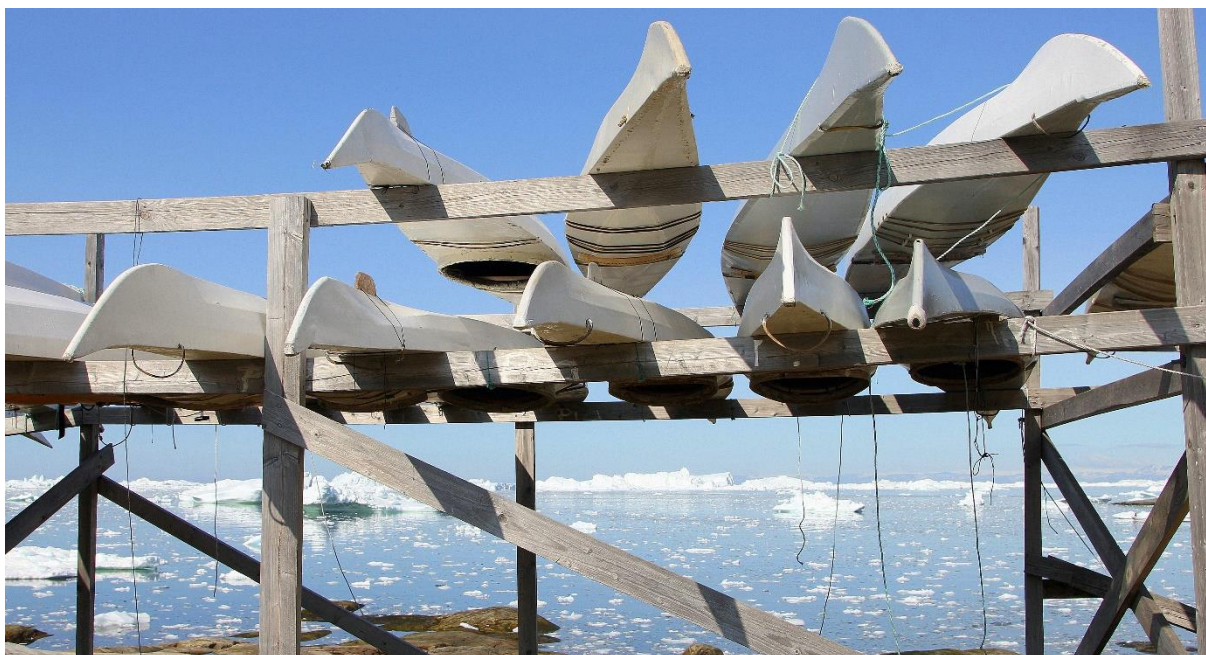
Qajaq stativ i Ilulissat.

I forhold til folkeoplysnings- og informationsindsatsen blev arbejds sproget livligt drøftet og debatteret under seminaret. Til slut blev kommissionen enige om, at det primært bør være det grønlandske sprog der skal anvendes, dog således at der i forbindelse med borgermøder og lignende altid skal være mulighed for simultan tolkning fra grønlandsk til dansk, og omvendt. Det skal endvidere nævnes, at etiske retningslinjer i forbindelse med oplysnings- og informationsindsatsen og i forhold til borgerinddragelsen blev forelagt for kommissionen.