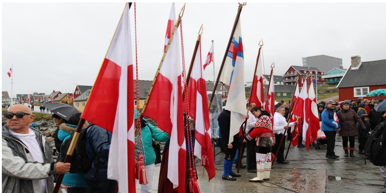
Ullortuneq 2018, Nuummi inuiattut ullorsiortut.