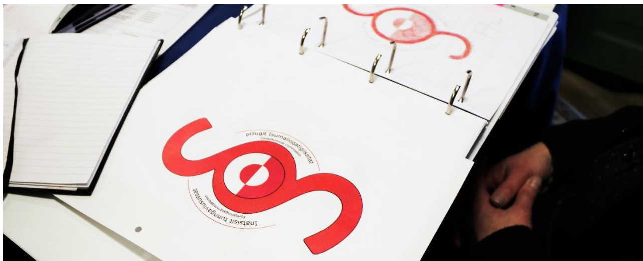
Inatsisit tunngaviusussat pillugit Isumalioqatigiissitat Logoat.

Piffissami 1. januaari – 10. septembari 2018 tikillugu allattoqarfik inini attartukkani utaqqiisaasumik najugaarpoq (Samuel Kleinschmidtsvej 15, st.), kingornali Noorlernut nr. 4-mi allermi, Nuup Katersortarfiata eqqaaniittumi, allaffeqarfimmut naleqqunnerusumut nuutinneqarluni.