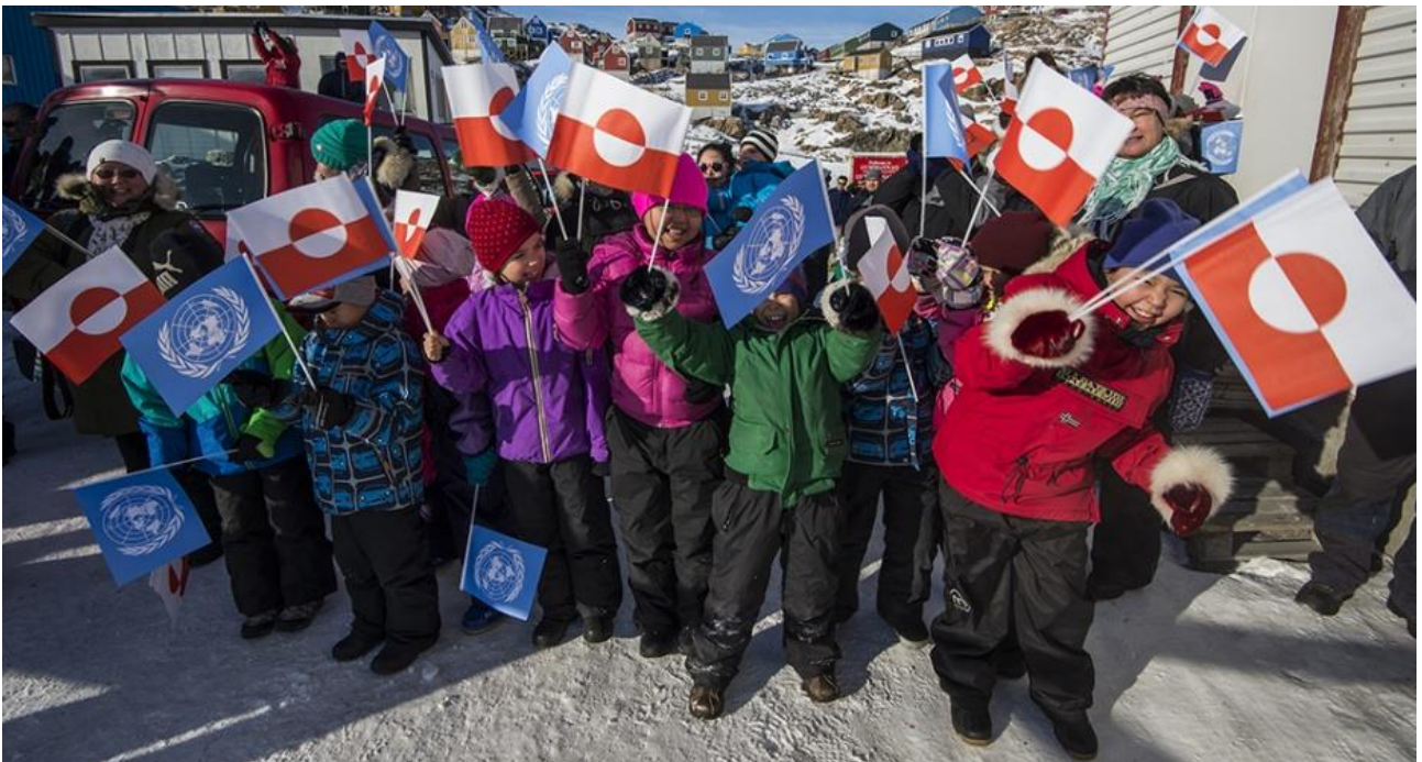
Ban Ki Moon Uummannamut marts 2014 tikimmat tikilluaqqusisut.