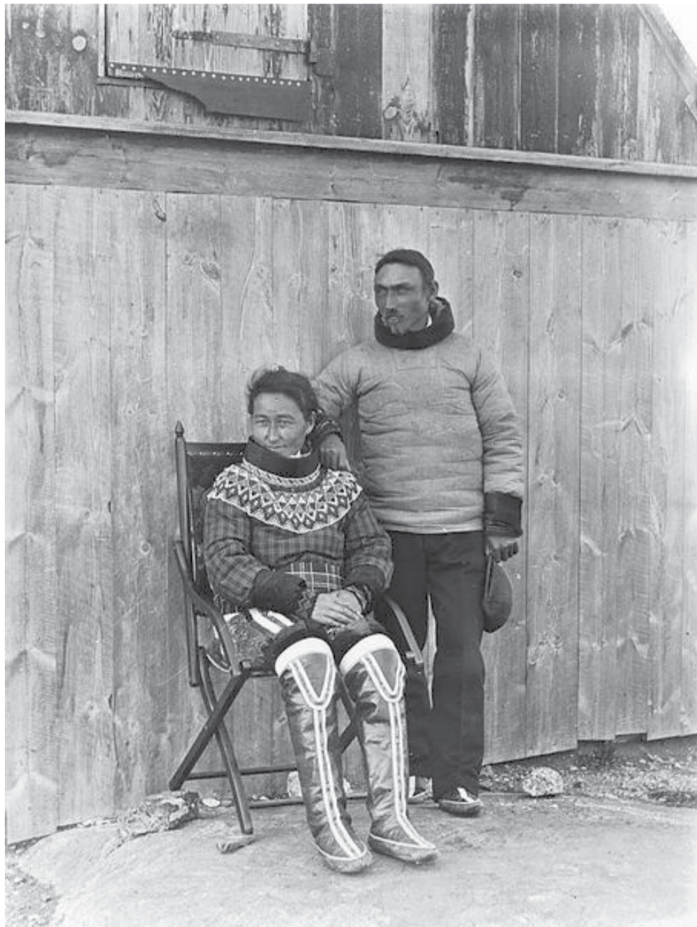
Kalaallit tunngaviusumik inatsiseqqaavat ilaatigut sanngiitsortaasunik ikiuunnissamik meeqqallu qanoq perorsarneqarnissaannik innuttaasunut ilitsersuisimavoq.

Grønlandernes første grundlov skulle blandt andet vejlede befolkningen til at hjælpe de svage og hvordan børnene skulle opdrages.