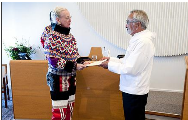
Saamerlerniit: Ataqqinartorsuaq Dronning Margrethe II aamma taamanikkut Inatsisartuni Siulittaasusoq Josef Motzfeldt Namminersorneq pillugu inatsisip tunniunneqarnerani

Tunngaviatigut oqaasertanut siunnersuut 2.b+ ajornanngitsumik oqaasertanut siunnersuut 2.a-mut aamma 2.a+-imut ataqatigiissinneqarsinnaavoq.