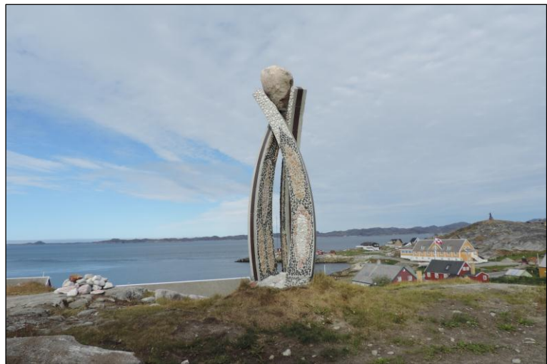
Inussuk eqqumiitsuliortumit Niels Motzfeldt-imit sananeqartoq Kalaallit Nunaata ataatsimooqatigiittuuneranut ilisarnaatitut inussuliaq

Qulaani allassimasut tassaapput ukiorpassuarni ingerlanneqartussamut namminiilivinnissamut sulinerup ingerlanneqarsinnaaneranut takorluuineq.