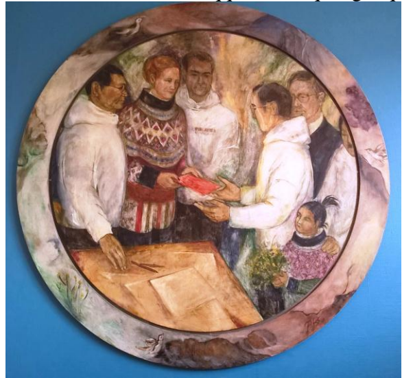
Dronning Margrethe-ip Namminersornerullutik oqartussat inatsisaat landsrådip siulittaasuanut Lars Chemnitz-imut tunniuppaa 1. maj 1979 Kalaallit Nunaanni Namminersornerullutik Oqartussat pilersinneqarnerannut atatillugu nalliuttorsiorpalaartumik katerisimaarnermi

inatsisinut tunngaviusussanut isumalioqatigiissitami ingerlanneqartariaqartoq – aalajangiineq 2015-imi Inatsisartunit uppersarneqaqqittoq. Taamaalilluni nassuiaammi matumani tunngavittut piumasaqaataavoq inatsisinut tunngaviusussanut kalaallit isumalioqatigiissitaat qanoq pilersinneqarsinnaanersoq nassuiarneqassasoq. Taamatut isumalioqatigiissitami ilaasortassanik toqqaanissamut qinersinissamulluunniit piumasaqaatit pillugit, nunap aqqissuussaananut aqunneqarneranullu maleruagassanik tunngaviusussanik suliaqarnissamut piffissat atugassarititaasut imaluunniit nunap aqqissuussaananut aqunneqarneranullu maleruagassanik tunngaviusussanik allataqarneq pillugu namminermi erseqqittuliortoqanngilaq.